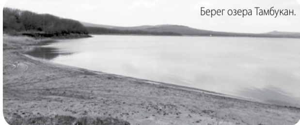
Берег озера Тамбукан.