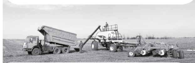
Аграрии края обеспечены семенами практически по всем группам сельхозкультур.

Сельхозтоваропроизводители Ставрополья завершают сев яровых зерновых культур, сообщили в минсельхозе региона.