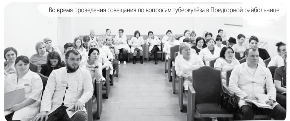
Во время проведения совещания по вопросам туберкулёза в Предгорной райбольнице.

Мы не можем до конца победить туберкулёз потому, что он приобретает новые фор-